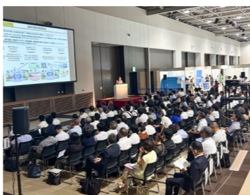
※出展企業一覧を裏面に記載