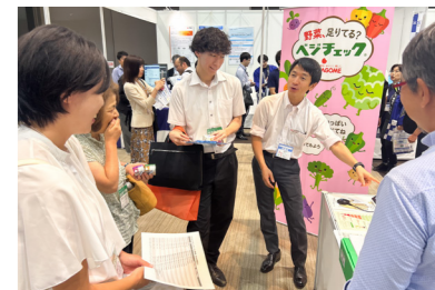
※出展企業一覧を裏面に記載